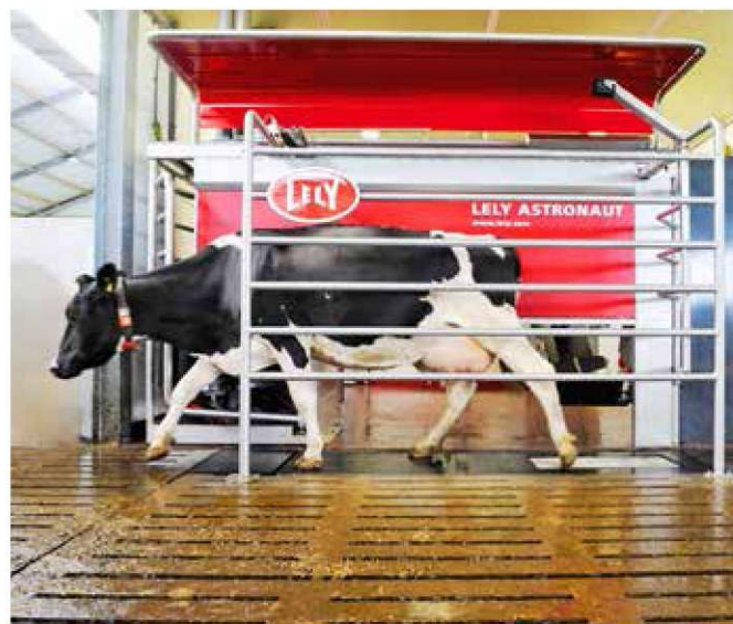
▲ Рис. 3. Процесс выхода коровы после доения.