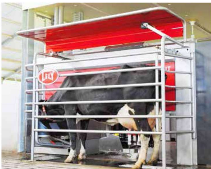
▲ Рис. 2. Процесс доения Lely Astronaut A4.