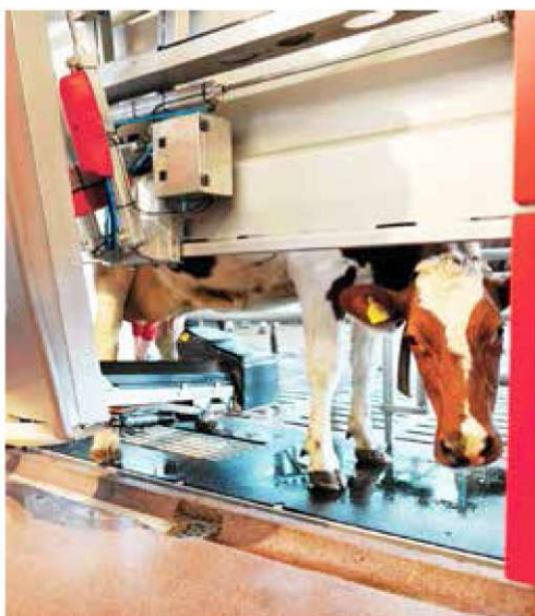
▼ Рис. 1. Процесс подготовки коровы Lely Astronaut A4.

Роботизированное доение происходит с помощью встроенных датчиков, которые в состоянии проконтролировать качество полученного молока по четвертям вымени индивидуально от каждой коровы (количество соматических клеток в молоке, заболеваемость маститом, цветность молока, содержание жира и белка и т.д.). Данные показатели важны в том отношении, что можно выявить заболевание вымени животного на ранней (субклинической) стадии ее развития и принять соответствующие меры лечения. В станке, где доится корова, достаточно высокий уровень комфорта: мягкий пол; мойка сосков вымени производится теплой водой с щетками; быстрая и точная насадка молочных стаканов на соски; бесконтактное определение положения коровы; очистка щеток паром и мойка стаканов после каждой дойки коровы (рис. 1, 2, 3). Для того чтобы доение проходило комфортно для коровы, необходимо оптимальное расположение доильного аппарата на сосках вымени,